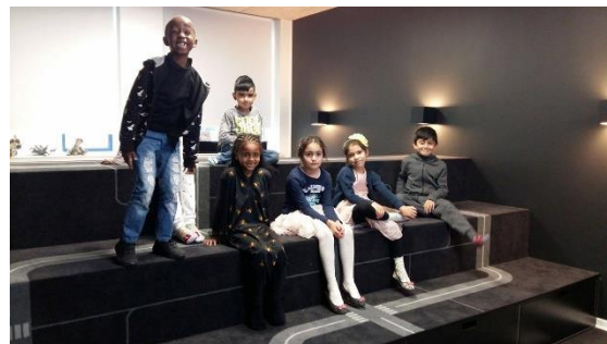
Eleverne på Søndervangskolen er glade for de lange skoledage.

Søndervangskolen i Viby syd for Aarhus har man ti års erfaring med at drive heldagsskole. Her går alle elever i skole fra kl. 8.15 til 15.45 på nær om onsdagen, hvor de har fri kl. 14. Det giver en undervisningsuge på 38 timer.